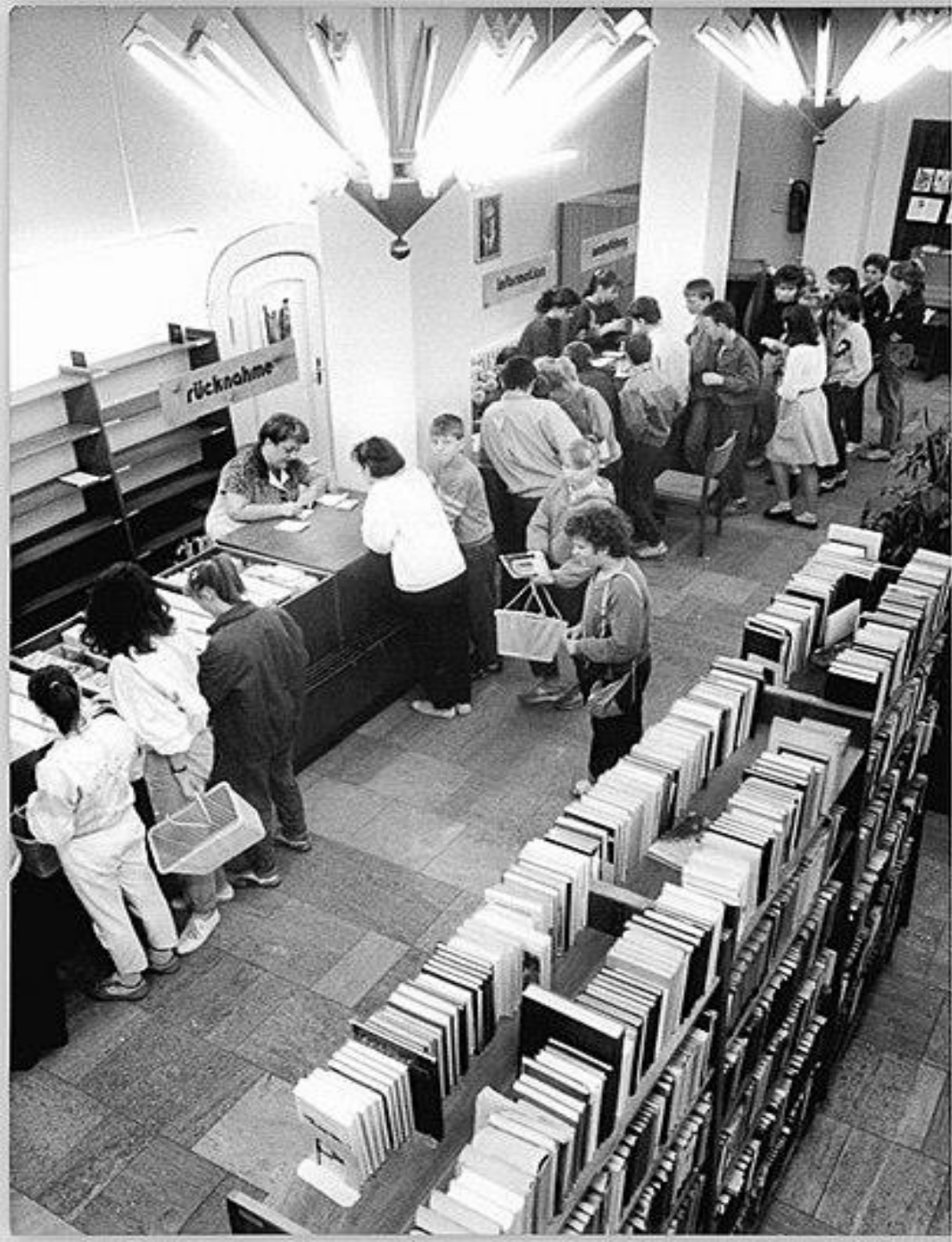
20. Oktober 1988